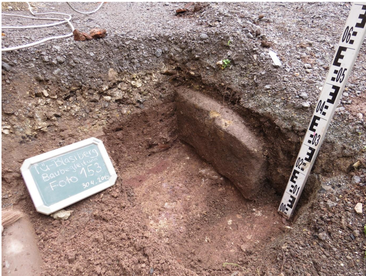
Abb. 2 Das einlagig erhaltene, aus Sandsteinquadern errichtete Fundament eines Anbaus an das Renaissanceschloss, wegen der geringen Tiefe vermutlich zu einem Portalvorbau gehörig. Vom Südeck des Vorbaus Richtung Schloss ist nur noch die Standspur des zuvor vom Bagger ausgebrochenen zweiten Quaders zu erkennen.

Schlosszeitlich datieren ein mutmaßlicher Portalvorbau an der östlichen Schauseite des Schlosses, verschiedene sich ablösende Abwasserkanäle Richtung Nordhang (s. Abb. 1), ein Vorgängerbau des heutigen Backsteingebäudes (auf Plan „Nebengebäude“), gegenüber diesem knapp 3 m nach Westen verrückt. Vom im 17./18. Jh. bildlich überlieferten, in Fachwerk errichteten Querflügel nach Norden fehlt archäologisch bislang jede Spur.