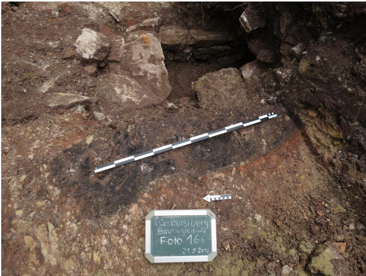
Abb. 1 Der liegende Ofen nördlich des Schlosses von WNW: Der mit holzkohlehaltigem Sediment verfüllte Feuerungskanal ist an den Seiten verziegelt. Im Profil ist noch eine aus den anstehenden bunten Mergeln „herausgeschälte“ Ofenbankstruktur zu erkennen. Im Osten ist der Ofen durch einen querenden frühneuzeitlichen Kanal gestört.

Befunde können nicht durch Funde datiert werden, können aufgrund ihrer Lage aber kaum gleichzeitig mit dem Schloss bestanden haben.