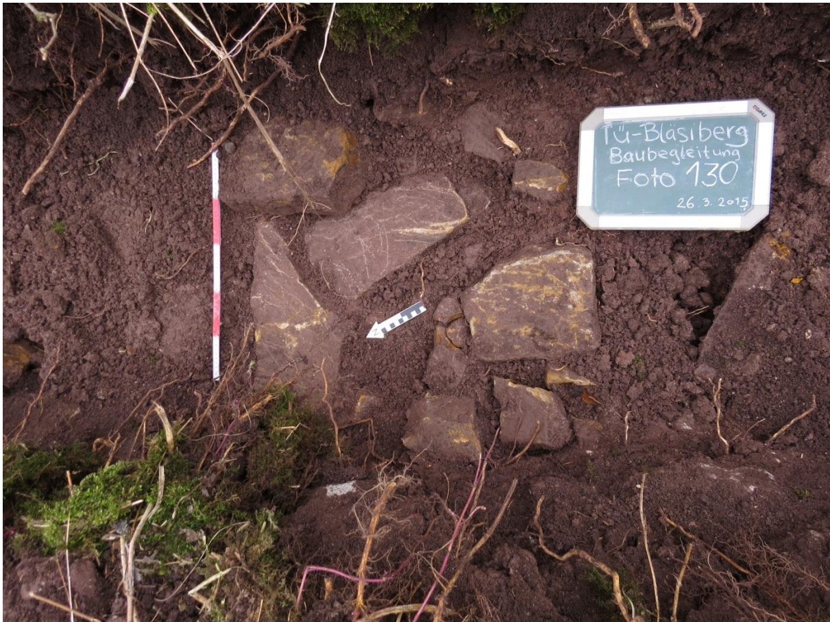
Abb. 3 Ansicht von Südwesten (Achtung! Falsch ausgerichteter Nordpfeil) auf die Plateau-Außenmauer des neuzeitlichen Schlosses.