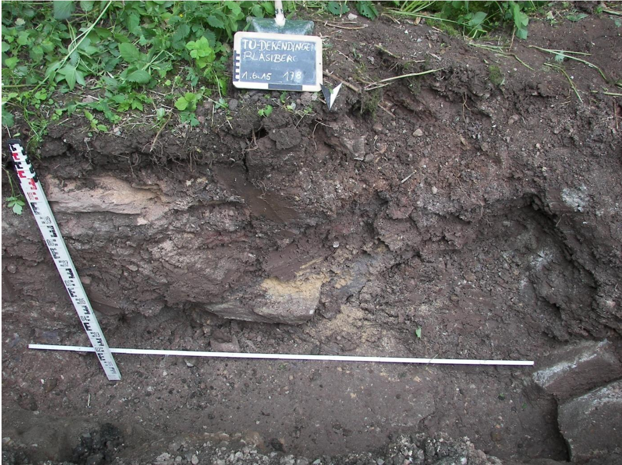
Abb. 5 Südprofil Schnitt 27 unmittelbar vor dessen Westende. Ganz rechts zwei verkippte Steinquader, links dahinter ein großer Ausbruch zu einem vom Bagger entfernten weiteren Quader.