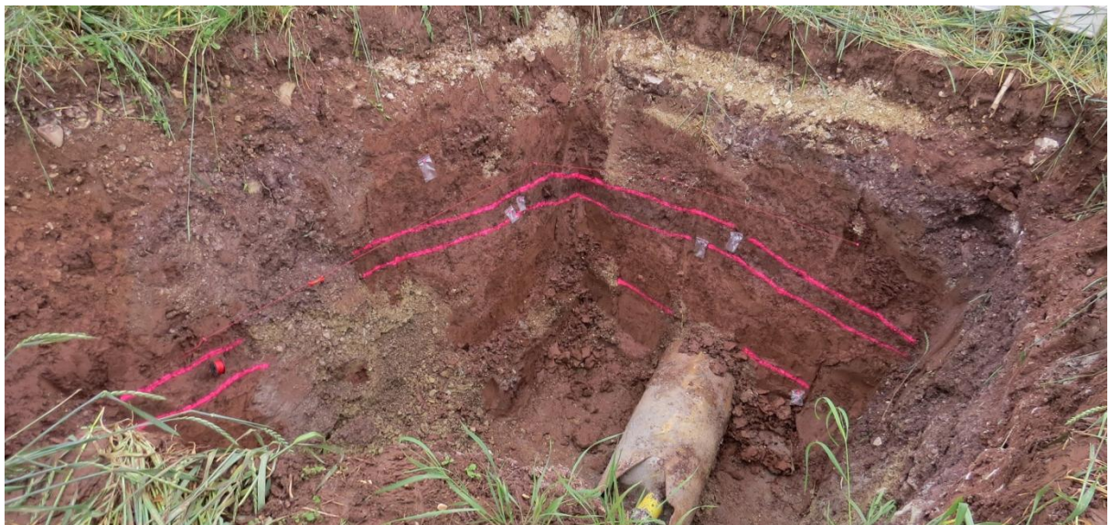
Abb. 6 Schachtgrube an der B 27 mit farblich hervorgehobenen Befundgrenzen und Fundtüten im Profil, von NO. Die hallstattzeitliche „Brandschicht“ zieht über das gesamte Süd- und Westprofil. Das 50 cm breite Leerrohr im Westprofil ist zwischen Schacht und B 27 durchgeschoben und besitzt keine Baugrube.